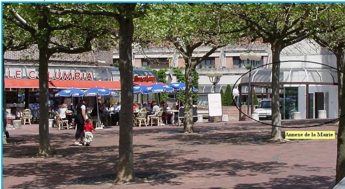
Mairie Annexe Cergy Préfecture

Téléphone : 01 34 33 45 65 - Télécopie : 01 30 30 45 88