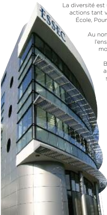
Campus de Cergy

Les équipes ESSEC sont à votre disposition pour toute information complémentaire.