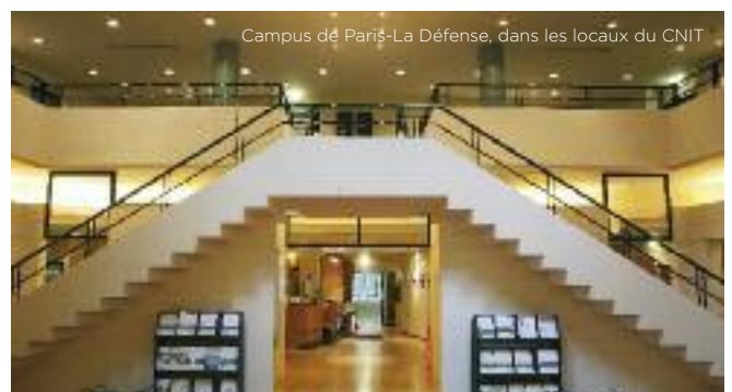
Campus de Paris-La Défense, dans les locaux du CNIT