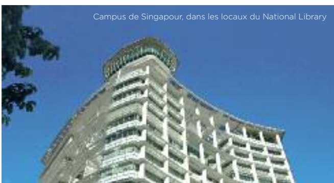
Campus de Singapour, dans les locaux du National Library